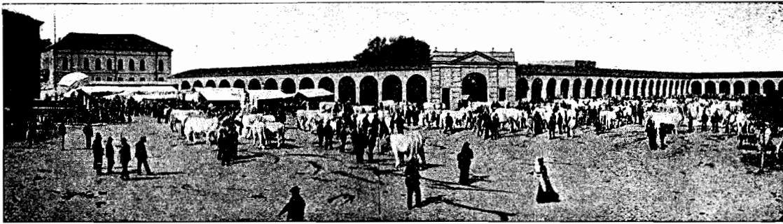
Mercato dei bovini in Moncalvo. (Fotografia del farm. sig. Garellò).