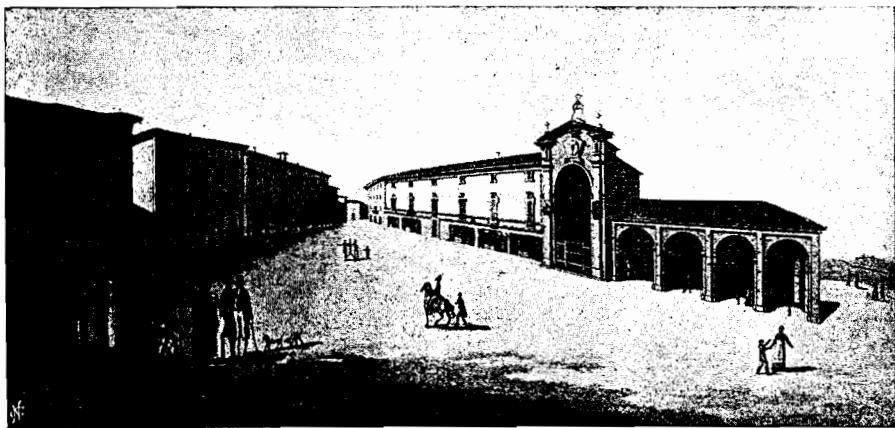
La Piazza di Moncalvo secondo una stampa antica.