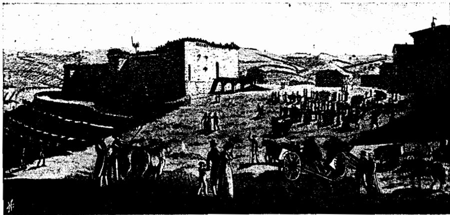
Le Fortificazioni e il Castello di Moncalvo secondo una stampa antica.