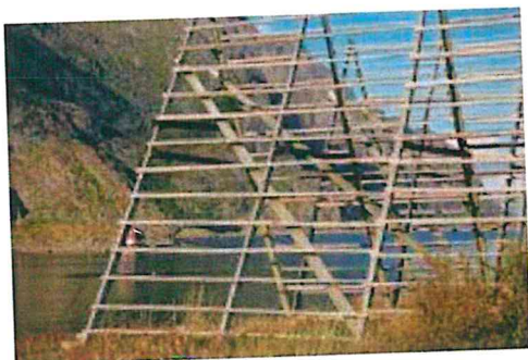
Figura. 4. Disposizione del raccolto organizzato in fasci sull'essiccatoio di legno.

E foto e) per strutture propriamente predisposte per l'arieggiamento e l'essiccazione.